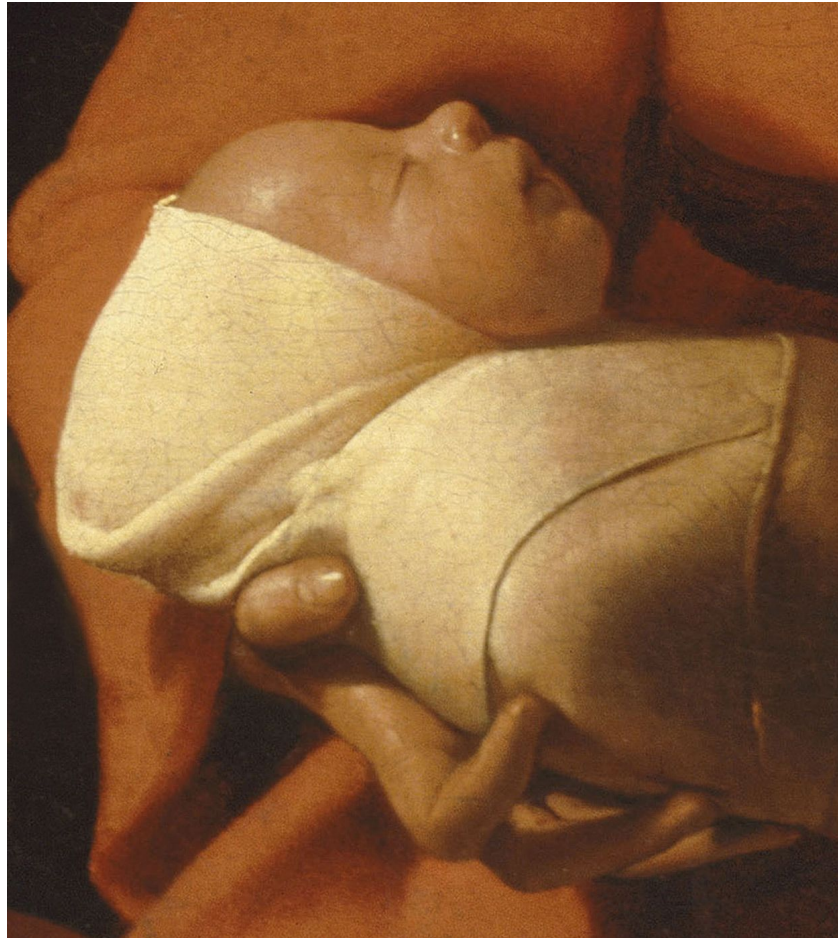
Le nouveau-né (détail), Georges DE LA TOUR, huile sur toile datant de 1648, conservée au Musée des Beaux-Arts de Rennes.